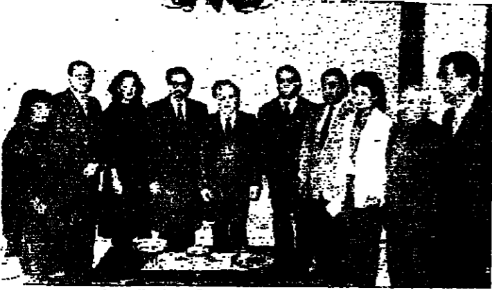
الكتاب البري يتوسط بعثة المؤسسة وممثل الجمعيات